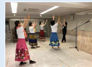
賛美フラの練習の様子